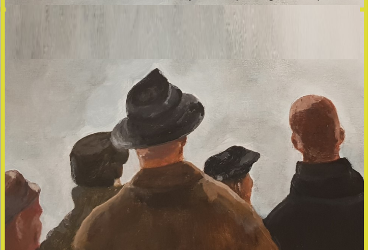
Kunsthuis DORP 16 – Zevergem (De Pinte aan de Schelde ©) www.kunsthuisdorp16.be

Stuur uw mailadres door via de site en wij houden u op de hoogte van de expo's.