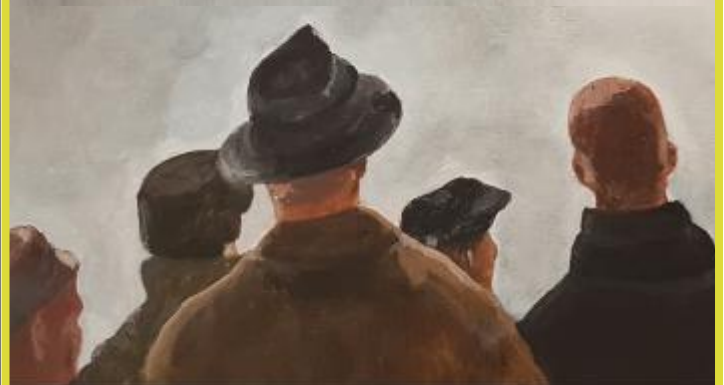
Kunsthuis DORP 16 – Zevergem (De Pinte aan de Schelde ©) www.kunsthuisdorp16.be

Stuur uw mailadres door via de site en wij houden u op de hoogte van de expo's.